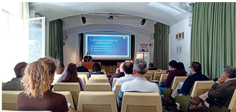
Asistentes al IV Foro SEEC–Madrid (Fundación Pastor, 2022)

El V Foro SEEC-Madrid de debate y actualidad sobre el Mundo Clásico está programado para la primavera de 2023. La información sobre el contenido, lugar y fecha concretos será publicada en www.seecmadrid.es .